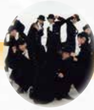
◎ BODY MOVIN' ◎ 埼玉県 日高市