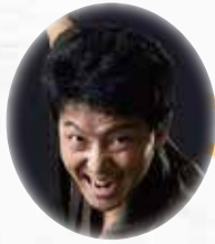
◎ 青山 郁彦 ◎ 大衆演劇から一人芝居、殺陣に女形に火吹きまで、時代劇を中心に活躍中。