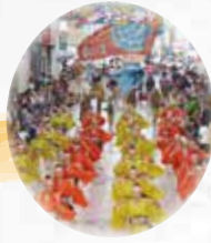
◎ よさこい舞人 ◎ 埼玉県 日高市