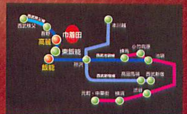
高麗駅下車 徒歩15分

※駐車台数が限られている為、公共交通機関をご利用ください。西武池袋線高麗駅より徒歩15分、JR川越線・八高線高麗川駅より徒歩45分