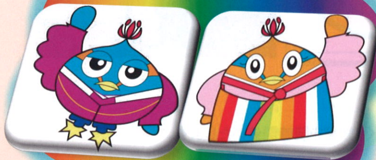
日高市マスコットキャラクター 「くりっかー・くりっぴー」