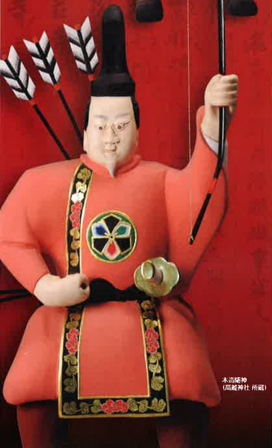
木造隨神 (高麗神社 所蔵)