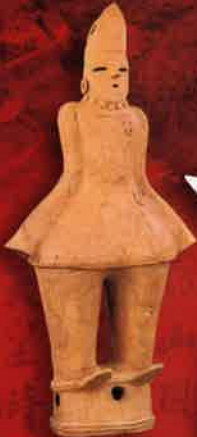
酒巻14号墳出土 人物埴輪 高袖の男子 (行田市郷土博物館 所蔵)