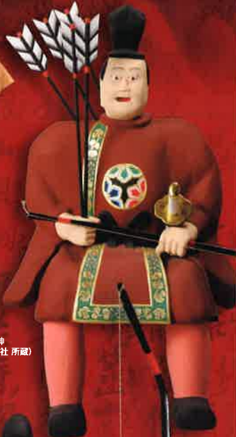
木造隨神 (高麗神社 所蔵)