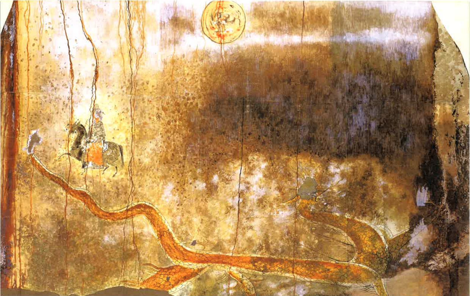
●横写梅山里四神塚「玄室東壁」(東京大学大学院工学系研究科建築学専攻)

霊亀2年(716)、現在の飯能市や日高市を中心とする地域に、1799人の高麗人 こまびと が移住し、高麗郡が置かれてから今年で1300年。