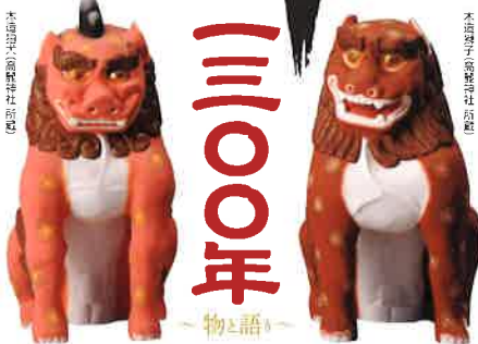
木造随神(高麗神社 所蔵)