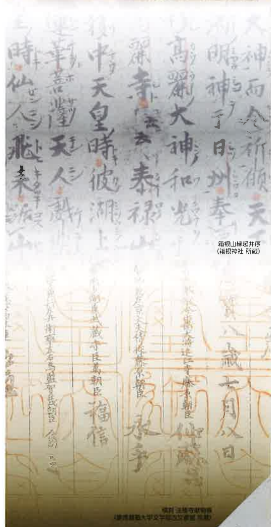
箱根山縁起并序