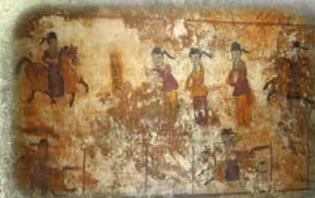
高句麗古墳「徳興里古墳」の壁画