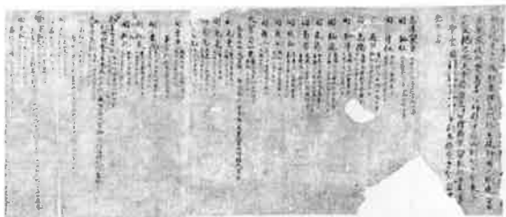
高麗氏系図(日高市指定文化財) 高麗神社蔵