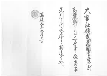
徳川家茂朱印状(日高市指定文化財) [1860年] 高麗神社蔵

いまから 1300 年前。当時の日本は、わたしたちが想像するより、遥かに国際的な環境の中にあった。660 年に百済が、668 年に高句麗が滅亡すると、倭国に多くの人々が逃れてくる。そして 716 年には、東国に移住していた高句麗人 1799 人が武蔵国へ移され、高麗郡が設置された。本展覧会では、高麗王若光を祀る高麗神社の社宝なども交えて、高麗郡の成り立ちと、高麗神社の歴史を振り返りつつ、日本に根付いた渡来人の姿を跡付けていく。