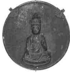
十一面観世音菩薩懸仏 [12-13世紀] 高麗神社蔵