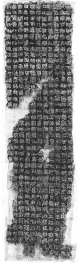
広開土王(好太王)碑拓本「高句麗」・414年 國學院大學図書館蔵