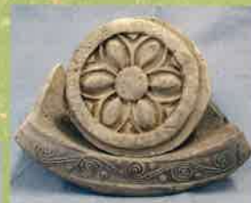
おなかげはいじ 女影廃寺から