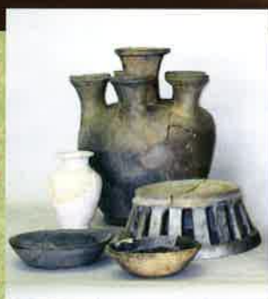
たかおかはいじ 高岡廃寺から