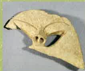
おおでらはいじ 大寺廃寺から

2017年 12月3日 日 13:30～16:30 受付・開場 13:00より 会場：日高市生涯学習センター 2F 視聴覚室