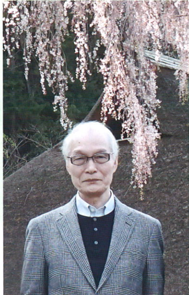
国重文・高麗家住宅のしだれ桜の前で

弥生時代以来、日本列島の文化形成には朝鮮半島・中国大陸の人・モノ、そして文化の影響が極めて大きかった。5・6世紀の古墳時代の墳墓に副葬された装身具・武具・馬具をはじめとする金属製品、集落で出土する須恵器などの多くは朝鮮に由来する。6世紀の明日香村都塚古墳の系譜にも百済との交流の痕跡がみられる。7世紀の飛鳥寺には百済・高句麗との交流のほか、さらに中国北齊の仏教の影がうかがわれ、西域に源流をたどりうる。7世紀後半、飛鳥には新羅人が来て住み、その仏教、文字、その他の文化の普及した様子が佐波理（銅合金）製品、木簡、角筆文献、土木技術、貨幣などに認められる。