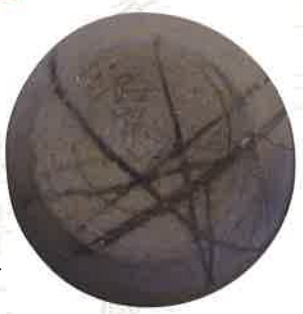
坂戸市 宮町遺跡出土 「路家」墨書須恵器