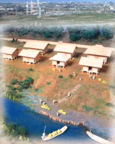
厚谷市 中宿遺跡 正倉復元模型