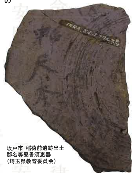
坂戸市 稲荷前遺跡出土 郡名等墨書須恵器(埼玉県教育委員会)