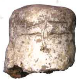
深谷市 幡羅遺跡出土 人面線刻土製支脚(深谷市教育委員会)