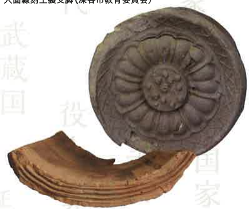
熊谷市 西別府廃寺出土 軒丸瓦・軒平瓦(熊谷市教育委員会)