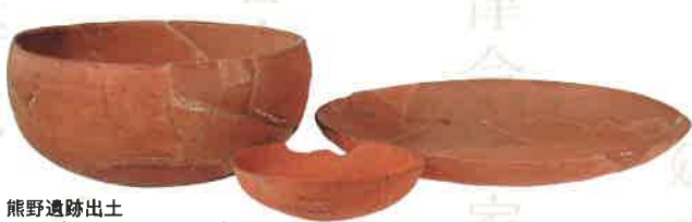
深谷市 熊野遺跡出土 畿内産土師器(深谷市教育委員会)