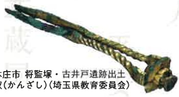
本庄市 将監塚・古井戸遺跡出土 釵(かんざし)(埼玉県教育委員会)