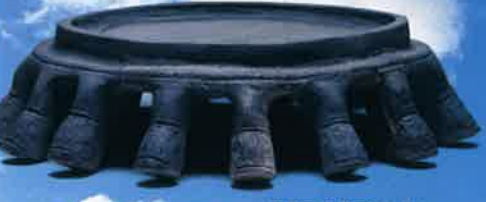
寄居町 末野塚跡群出土 鉄押碇(埼玉県教育委員会)