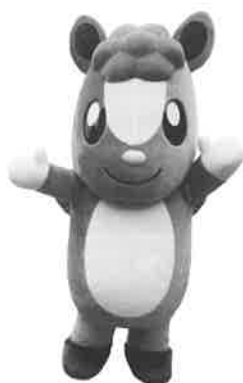
日高市マスコットキャラクター くりっかー・くりっぴー