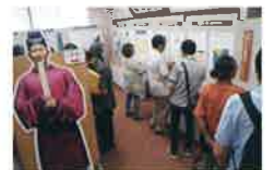
昨年の高麗郡偉人伝の様子

昨年に続き今年8/22(土)～8/30(日)、高麗神社で高麗郡偉人伝「奈良時代のスーパー賢人 高麗福信Ⅱ」を開催。今年は福信にまつわる伝承を紹介します。深大寺(東京都調布市)の国宝白鳳仏や絵巻との関わり、そのほか長年伝えられてきたことにスポットを当て、多面的に福信をとらえます。