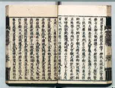
福信の墓伝(こうでん)が収録されている『続日本紀』延暦8年(789)10月乙酉条