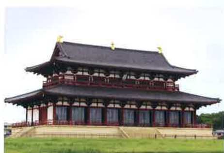
国の重要な儀式が行われた平城宮の宮殿「大極殿」(復原)。福信も時に出入りしたのでは

高麗郡出身の高麗福信(709～789)は高句麗からの渡来3世。上京し、相撲の技を評価され宮中に出仕。聖武天皇から桓武天皇まで6代5人の天皇に仕えた。大きな政変や反乱においても失脚することなく難局を乗り越え、それぞれの役職で優れた能力を発揮し、地方出身の渡来系官人としては異例の従三位(公卿)にまで出世。81年の生涯を終えた。