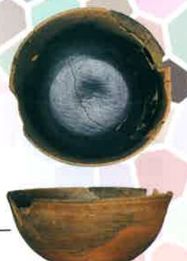
鳥ノ上遺跡出土 の黑色土器