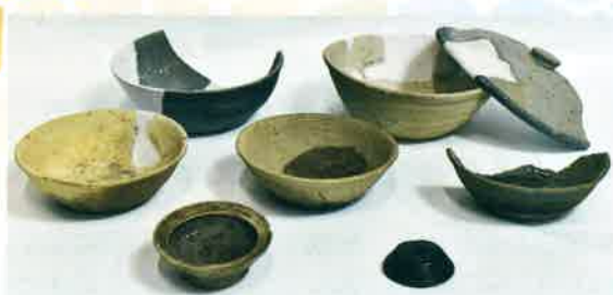
坂戸神社遺跡5区2号竪穴建物出土の須恵器