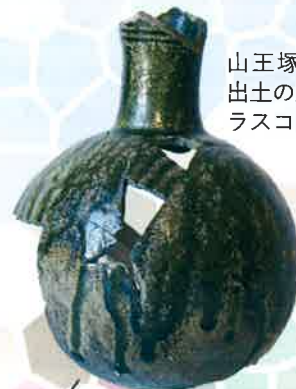
山王塚古墳石室 出土の須恵器（フ ラスコ形長頸瓶）