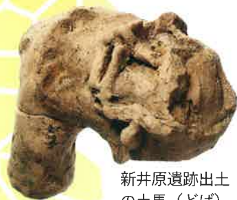
新井原遺跡出土 の土馬（どば）