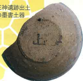
王神遺跡出土 の墨書土器