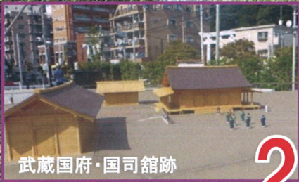
武蔵国府・国司館跡

府中市郷土の森博物館で開催中(11/5迄)の 企画展・古代国司と国司館 ～都から来た役人とそのすまい～ を見学します